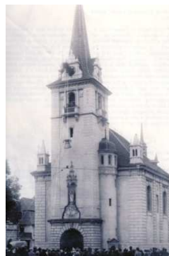
Instalace nových zvonů 13. 5. 1923

Dalším obdobím nejistoty procházel trmický kostel v letech 1972-1989. Z důvodu stále se zhoršujícího stavu stropní konstrukce nad lodí byl kostel roku 1972 uzavřen. Následně bylo započato s přípravou rozsáhlých oprav v té době pod patronací bratří salesiánů, kteří trmickou farnost v těchto letech spravovali. Vzhledem k období tzv. normalizace, bylo provádění oprav velmi komplikované z důvodu jak nedostatku finančních prostředků, tak i komplikací ze strany státních a stranických orgánů