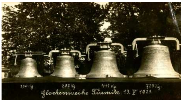
Nové zvony pro kostel Narození Panny Marie v Trmicích 13. května 1923

Nejtěžší ze zvonů vážil 723 kg, nejlehčí pak 130 kg. Bohužel během druhé světové války byly 3 zvony zrekvírovány pro vojenské účely. Ve věži zůstal jediný zvon o hmotnosti 207 kg.