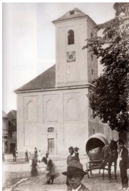
Kostel Narození Panny Marie v Trmicích kolem roku 1898, ještě před přestavbou