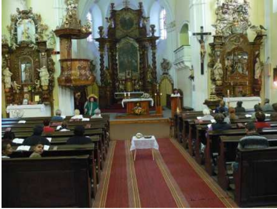
Interiér kostela Narození Panny Marie v současnosti