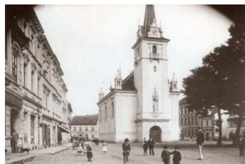
Kostel Narození Panny Marie v Trmicích kolem roku 1900, již po přestavbě.

Dne 13. května 1923 byly slavnostně vysvěceny a do věže kostela zavěšeny 4 nové zvony zhotovené českobudějovickou zvonařskou firmou Rudolfa Pernera.