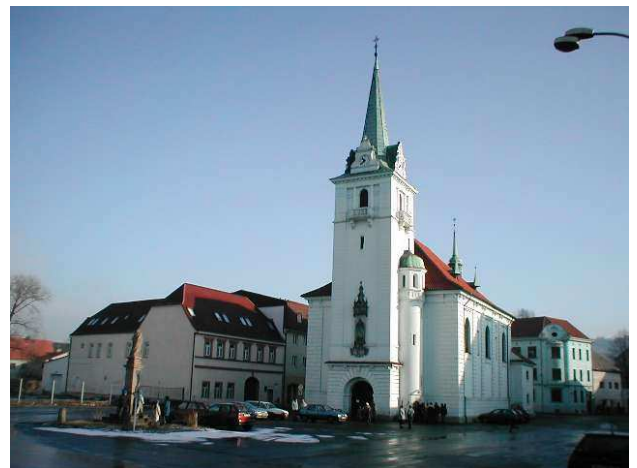
Současná podoba kostela Narození Panny Marie. Bude takto vypadat i po roce 2011?

Bohužel se nezadržitelně blíží rok 2011, který se stává dalším významným mezníkem v historii našeho kostela. Je to rok, který rozhodne, jaký osud kostel postihne. Stane se duchovním centrem jiné církve, sekty či náboženské skupiny? Změní úplně své poslání a stane se komerčním objektem např. skladištěm, autoservisem, centrem pro módní přehlídky nebo diskotékou? Stane se prázdným chátrajícím torzem, jež stihne osud mnoha dalších kostelů v severních Čechách?