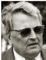
Oto Neubauer bývalý starosta města Trmice a bývalý senátor